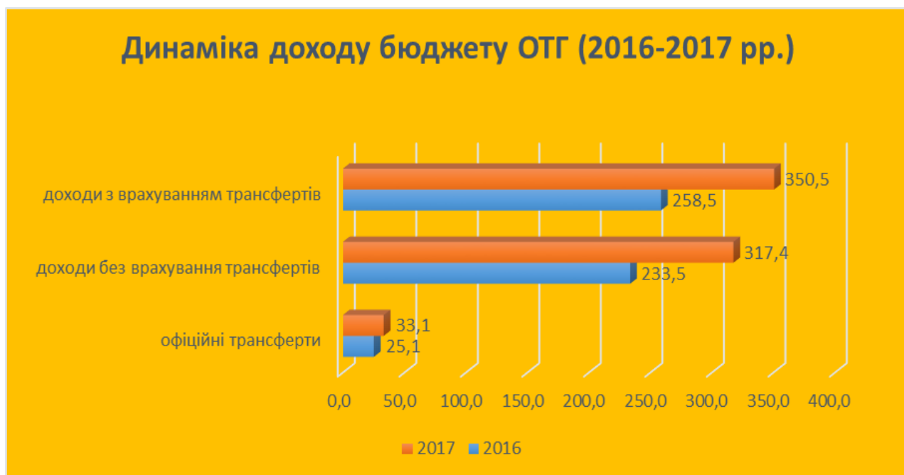
Рис. 1. Динаміка доходів бюджету ОТГ у 2016-2017 роках.

Динаміка доходу бюджету ОТГ за 2016-2017 рр. представлена на рис. 1.