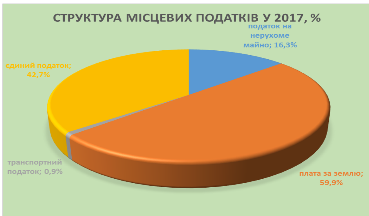
Рис. 6. Структура місцевих податків і зборів у 2016-2017 рр.

Для порівняння: по Україні темп приросту єдиного податку – 35,7 відс. з огляду на зміни до податкового законодавства.