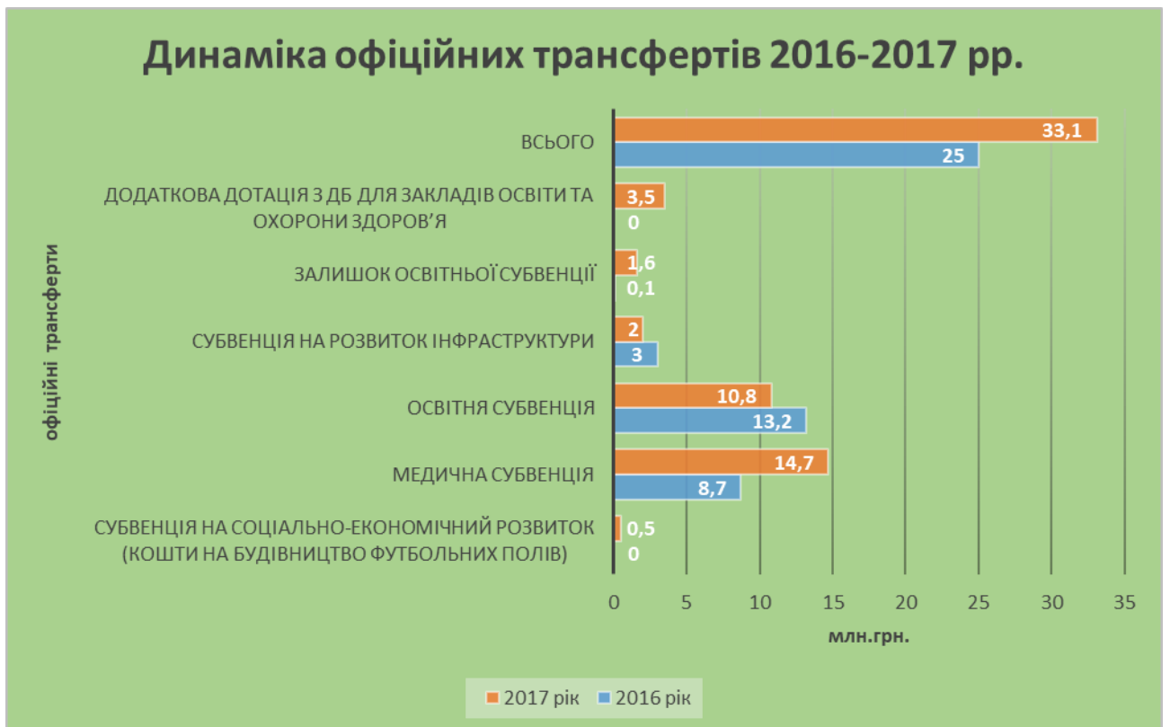
Рис. 7. Динаміка офіційних трансфертів за 2016-2017 роки

У 2017 році бюджет громади отримав додатковий фінансовий ресурс з Державного бюджету у вигляді цільових субвенцій: