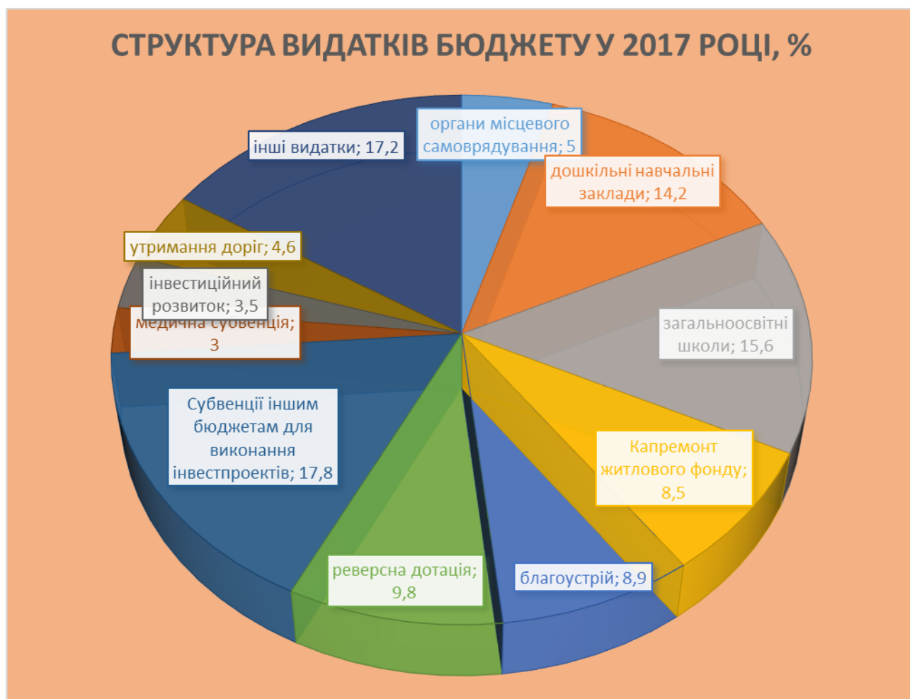
Рис. 8. Структура видатків бюджету ОТГ у 2017 році, %.

Всього у 2017 році видатки бюджету територіальної громади склали 356,0 млн.грн., з них видатки загального фонду – 172,4 млн.грн., спеціального – 183,6 млн.грн. (рис. 8).