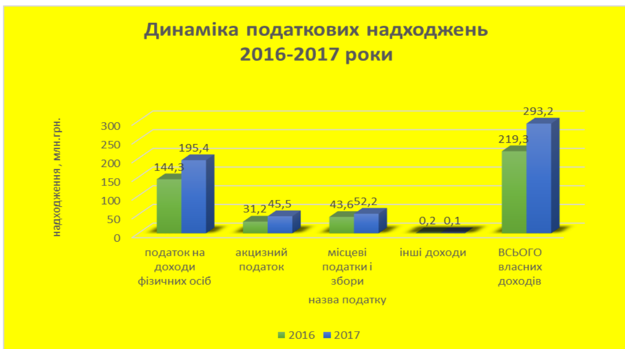
Рис. 4. Динаміка податкових надходжень Слобожанської ОТГ

Слід відмітити, що по всіх основних податках надходження зросли проти минулорічних. Динаміка надходжень податків за 2016-2017 роки представлена на рис. 4.